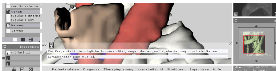
Abbildung 2: Die „Ergebnisse“ sind im Fenster in der Mitte links zu sehen. Hier kann der Chirurg Besonderheiten des Falles als Szene festhalten und mit einem Kommentar versehen.

Im Fenster „Ergebnisse“ können Erkenntnisse zum gegenwärtigen Fall festgehalten werden (Abbildung 2). Über das Symbol „Kamera“ kann eine Szene aufgenommen werden. Die Szene wird unmittelbar im „Ergebnisse“ Fenster gespeichert. Gleichzeitig zu dieser Prozedur öffnet sich ein Text- bzw. Tonfenster, in welchem Annotationen festgehalten werden können. Dieses Fenster öffnet sich im unteren Abschnitt des Betrachtungsfensters, um eine visuelle Verbindung zum aktuellen Arbeitsfokus darzustellen. Das Fenster „Ergebnisse“ bietet weiterhin die Option Erkenntnisse weiterzugeben. So können schwierige Zusammenhänge leicht mit anderen Kollegen besprochen werden, indem eine aufgenommene Szene ausgedruckt oder via Email verschickt wird.