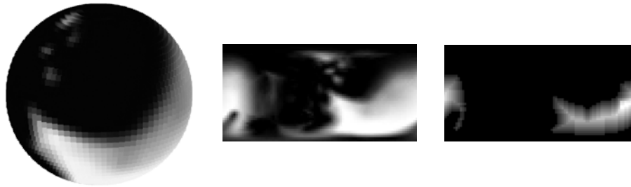
Abb. 3. (a) Resultierende Visibility Map einer Struktur. Die Kugel wird mittels Mercator-Entwurf auf eine ebene Fläche projiziert. (b) Zwischenergebnis der Bewertungsfunktion an einer Kameraposition, (c) Ergebnis nach Anwendung einer Distanzfunktion auf das binarisierte Zwischenergebnis.

Das Maximum der Bewertungsfunktion K stellt die neue Kameraposition dar. Die Kamera wird automatisch zu dieser Position bewegt. Eventuell verdeckende Strukturen werden ausgeblendet, soweit sie nicht zur Kontextvisualisierung nötig sind. Dieses Konzept ist leicht um zusätzliche Bewertungsparameter erweiterbar. Momentan sind folgende Bewertungsparameter in unserem System implementiert: