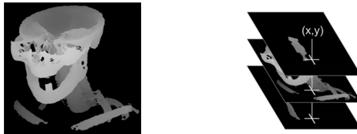
Abb. 2. (a) z -Buffer einer einzelnen segmentierten Struktur (Knochen), (b) Auswahl der z -Buffer-Werte aller Buffer an einer einzelnen Pixelposition,